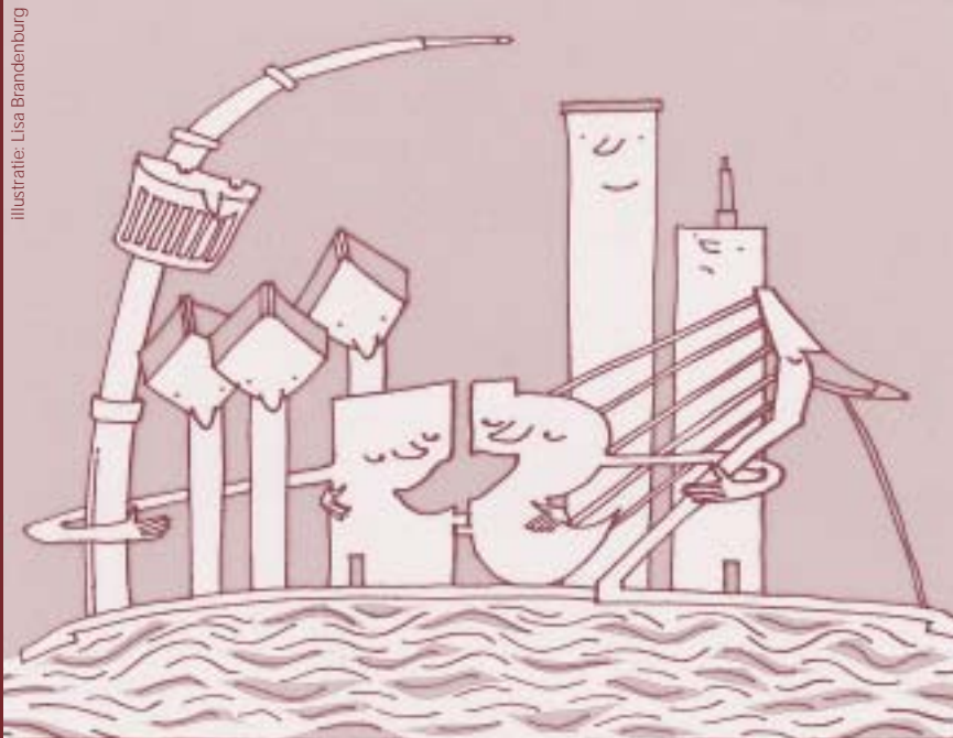
Illustratie: Lisa Brandenburg

In hogeschool & de stad laten we projecten zien van studenten of medewerkers van de Hogeschool Rotterdam die een maatschappelijke, technologische, economische of culturele bijdrage leveren aan de stad en regio Rotterdam.