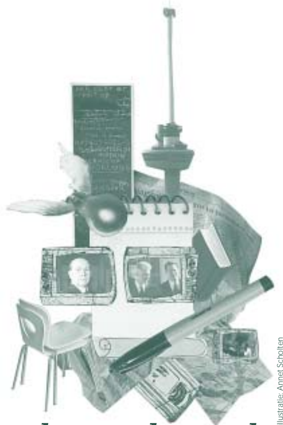
illustratie: Annet Scholten

Zaalvoetbal, Vietnamees, belasting-aangifte zelf verzorgen of zakelijk telefoneren in het Duits. Het keuzeonderwijs biedt de mogelijkheid om onderwijs te volgen bij een andere opleiding binnen de hogeschool om zo ook eens over de grenzen van je eigen studie heen te kijken. Profielen kijkt met je mee en ging op bezoek bij 'invloed van de media'.