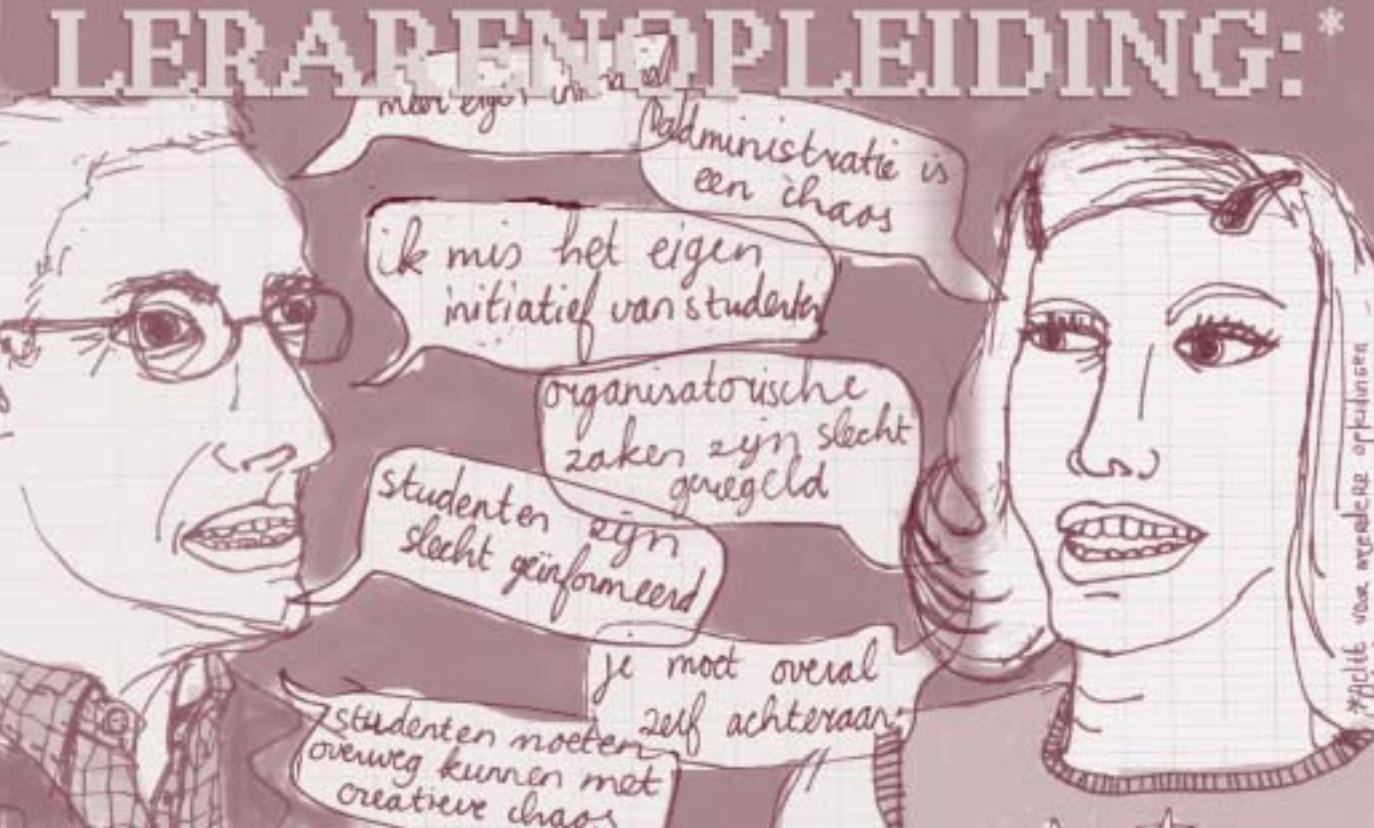
Illustratie: Kwannie Tang