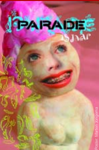
Poster: Martien Jongema