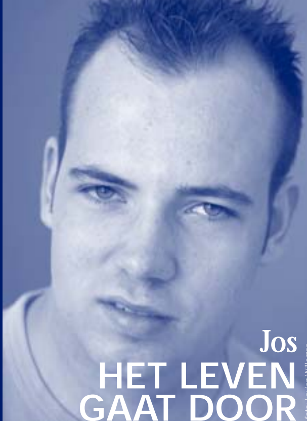
Jos HET LEVEN GAAT DOOR