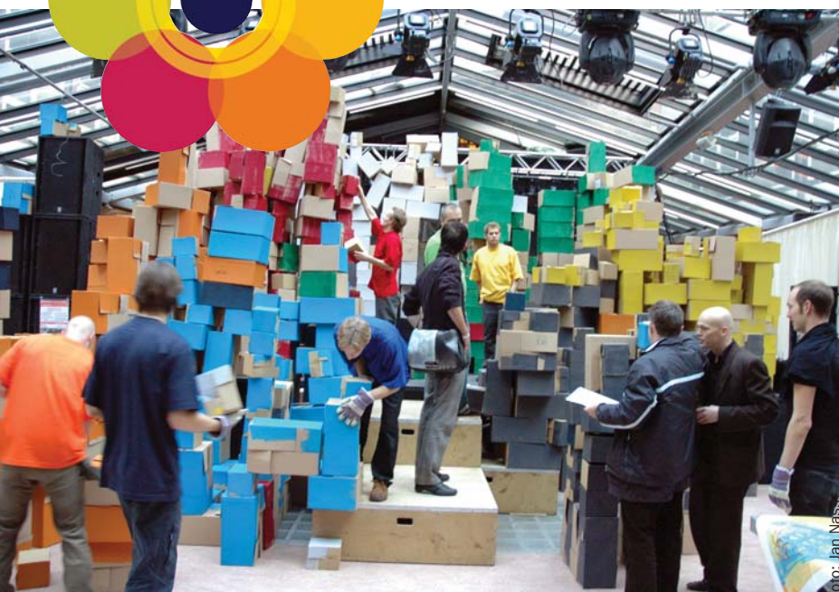
Tijdens de hogeschooldag kon elke medewerker een steentje bijdragen aan een bouwwerk van acht steden. Daarbij werden zij begeleid door RIBACS-studenten en kunstenaars.

De hogeschooldag Steden in zicht op 8 december jl. trok zo'n 1300 medewerkers die zich in ruim vijftig presentaties, workshops en debatten bezighielden met waar het op de HR allemaal om draait. Centraal stonden de acht steden van de HR en de wijze waarop zij het uitgangspunt van de hogeschool vertegenwoordigen: outside in, inside out .