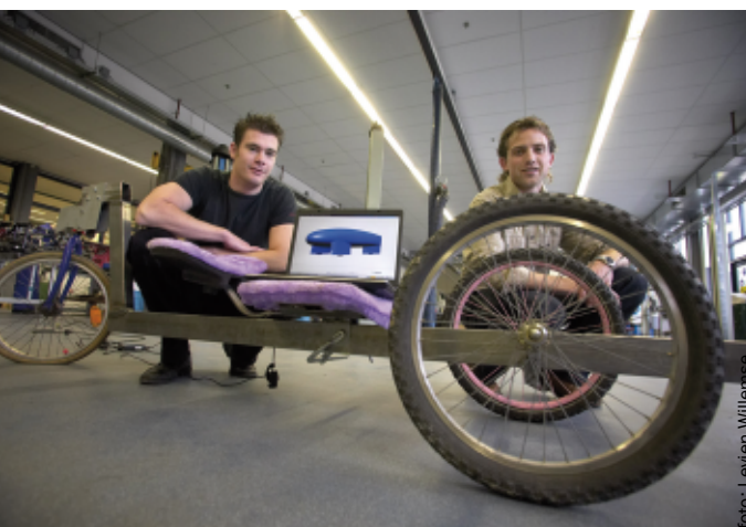
Voordat het voertuig wordt gebouwd, voeren de studenten testen uit met deze dummy.

Tien vierdejaarsstudenten autotechniek vormen samen het team 'Phidippides'. Als differentiatieopdracht nemen zij deel aan de Shell Eco-marathon in mei 2007. Het is voor het eerst dat de HR meedoet aan de marathon en het team zal helemaal van