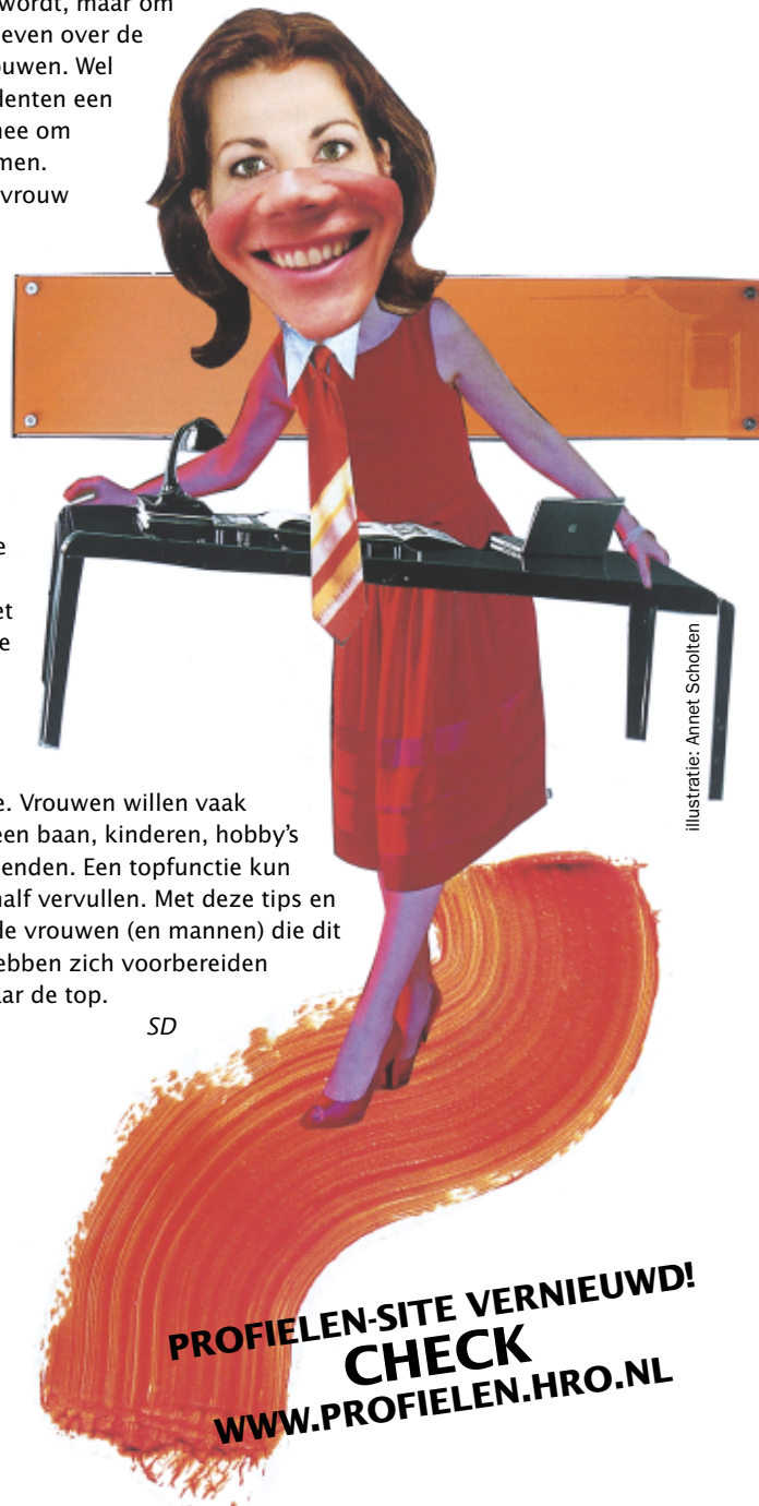
Illustratie: Annet Scholten

Nass laat weten dat dit keuzevak niet bedoeld is om de studente te leren hoe ze een topvrouw wordt, maar om informatie te geven over de positie van vrouwen. Wel krijgen de studenten een lijst met tips mee om hogerop te komen. Zo moet je als vrouw bijvoorbeeld niet zeuren. Vrouwen melden zich vaker ziek en hebben vaker psychische problemen dan mannen. Ook moet je de competitie aangaan en niet bang zijn om te concurreren met collega's. Daarnaast moet je kiezen voor je carrière. Vrouwen willen vaak alles tegelijk, een baan, kinderen, hobby's en tijd voor vrienden. Een topfunctie kun je echter niet half vervullen. Met deze tips en meer kunnen de vrouwen (en mannen) die dit vak gevolgd hebben zich voorbereiden op hun weg naar de top.