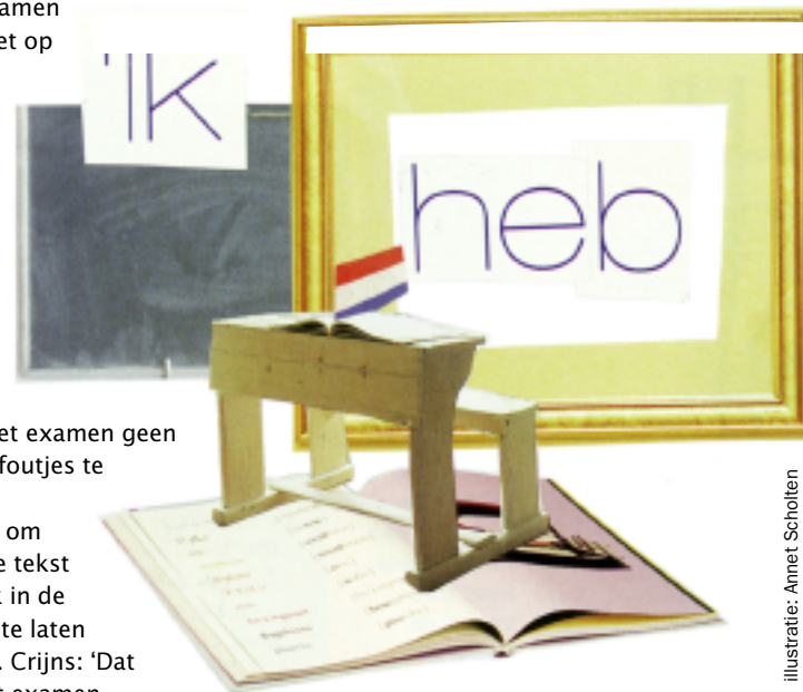
illustratie: Annet Scholten