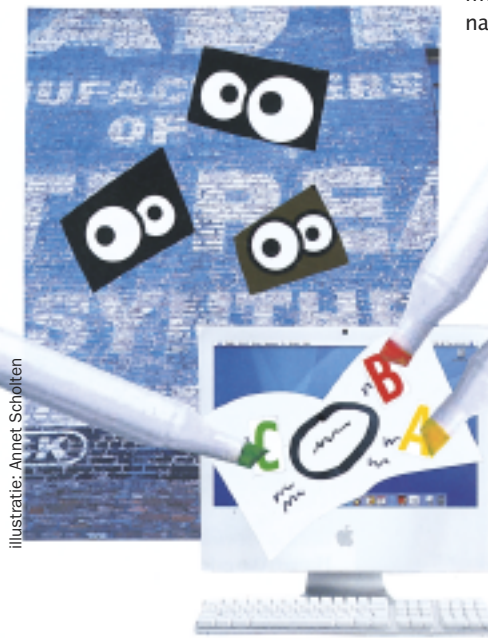
Illustratie: Annet Scholten

Reageren? Surf naar www.profielen.hro.nl .