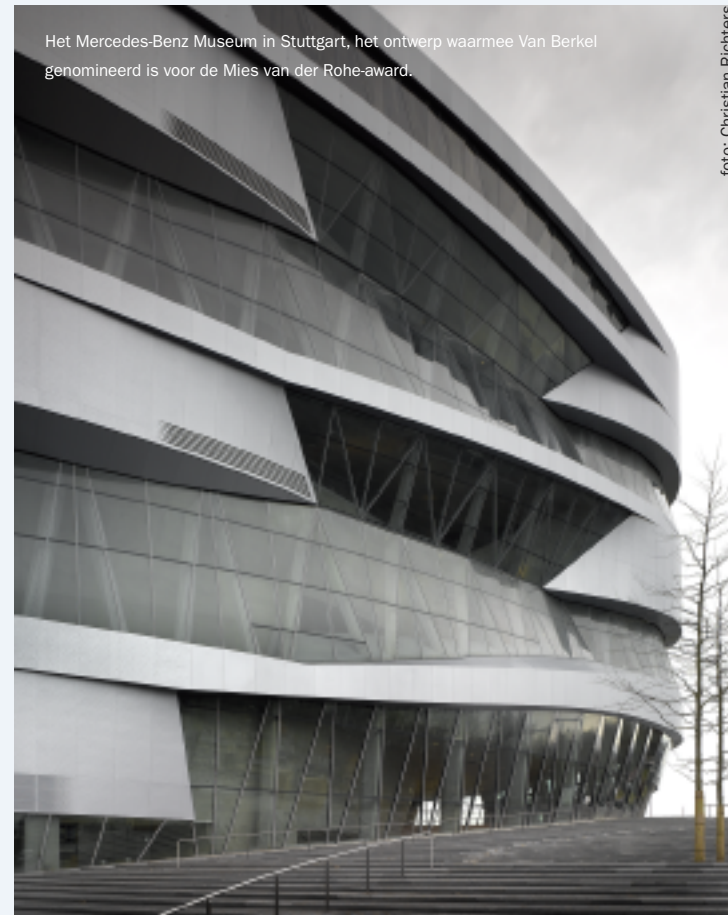
Het Mercedes-Benz Museum in Stuttgart, het ontwerp waarmee Van Berkel genomineerd is voor de Mies van der Rohe-award.