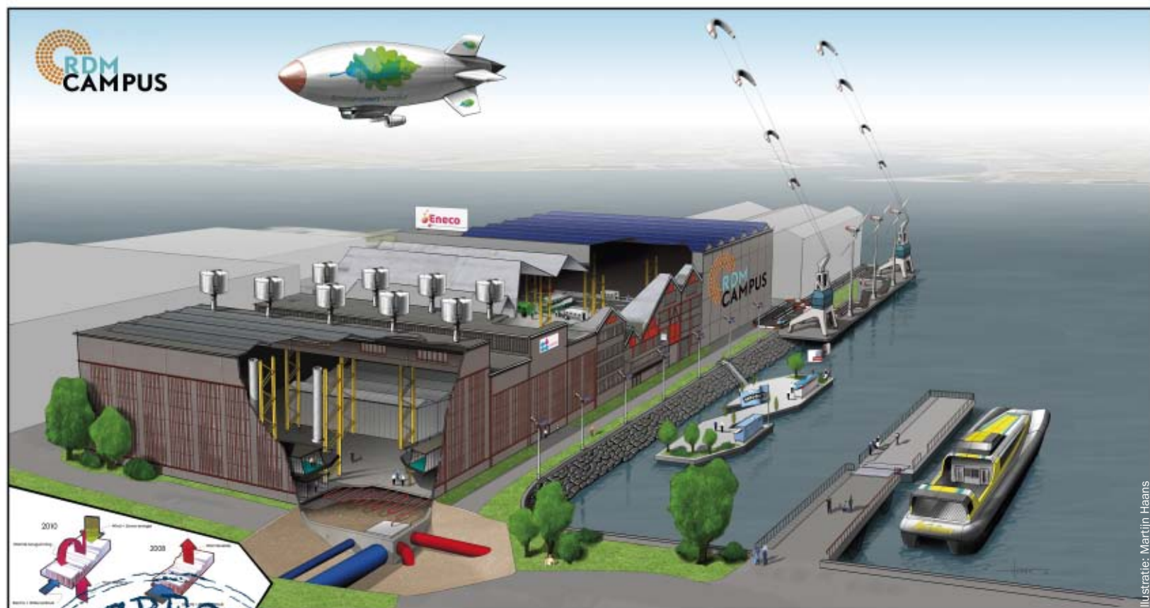
Illustratie: Martijn Haans