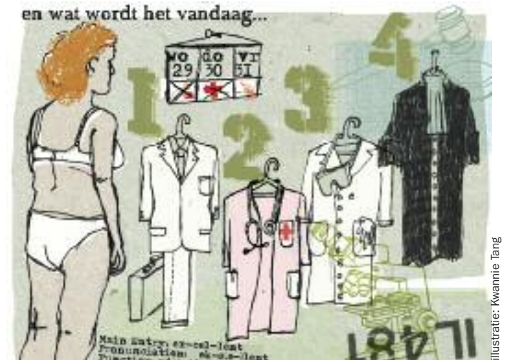
illustratie: Kwannie Tang

Een student is excellent als hij niet alleen zijn eigen vak goed verstaat. Van belang is vooral ook dat hij zodanig weet samen te werken met professionals uit andere beroepen dat het innovaties oplevert voor de beroepspraktijk. Voor de HR is dat excellentie. De hogeschool roept vanaf aanstaande februari enkele themaminors in het leven die zijn bedoeld