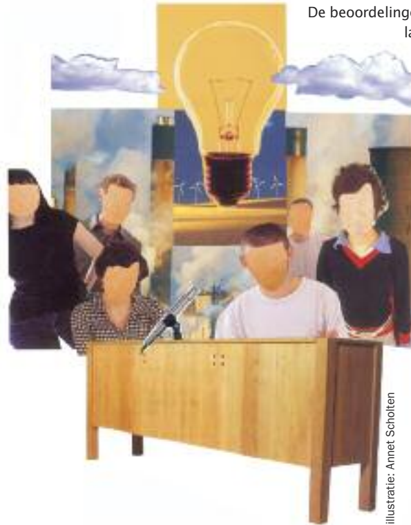
illustratie: Annet Scholten