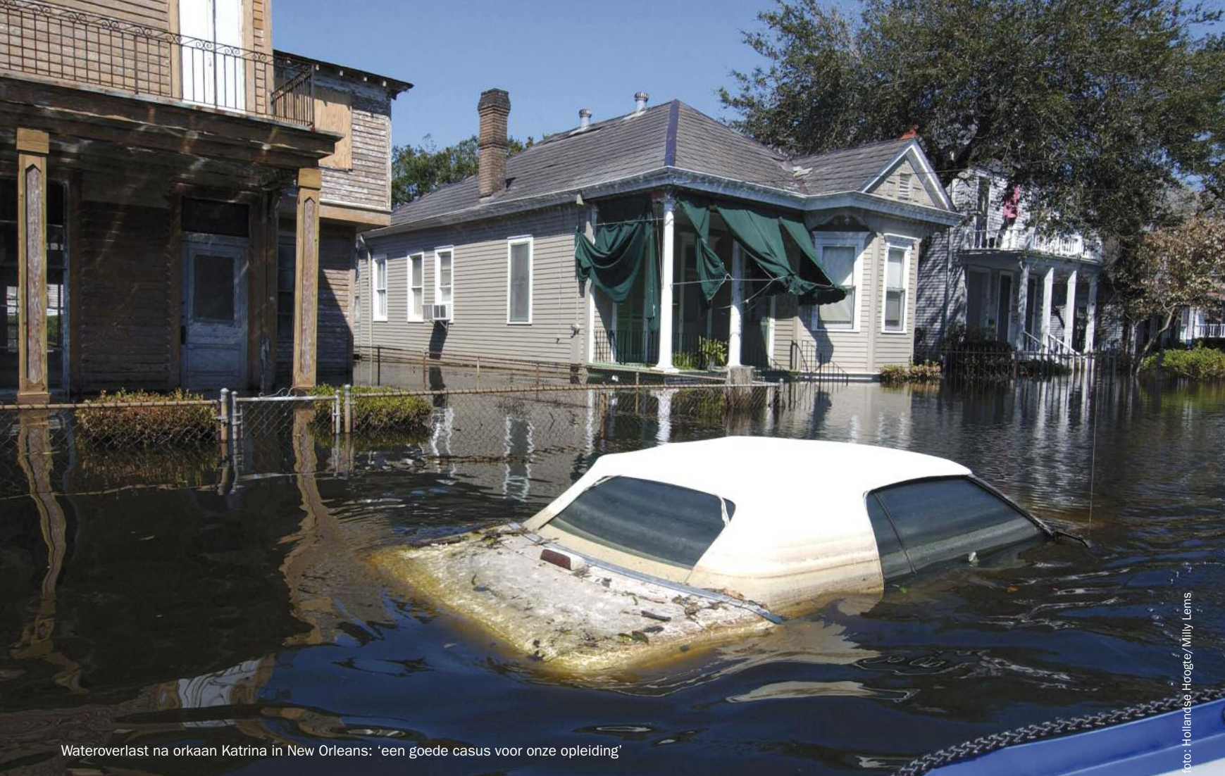
Wateroverlast na orkaan Katrina in New Orleans: 'een goede casus voor onze opleiding'