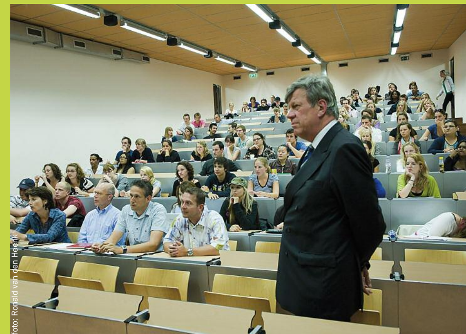
Opstelten: 'Ik kan wel langer over de Tour praten, maar dan wordt het romantisch'

die ons voor waren gegaan en ieder jaar gingen we weer naar de Tour om met de mensen te praten. Steeds kregen we te horen "patience monsieur le maire". Een student wil weten hoeveel extraatjes er zijn uitgedeeld tijdens het lobbyen om het comité van de Tour te overtuigen. 'Nul. Wij hebben daar een keer gegeten, op hun kosten. Toen zij bij ons kwamen, hebben wij betaald', antwoordt Opstelten. Uit zijn gastles spreekt een grote liefde voor de wielersport en de Tour de France. En nadat hij de hele aanloop naar de Rotterdamse Grand Départ in 2010 uit de doeken heeft gedaan, besluit Opstelten met de woorden: 'Ik kan er wel langer over spreken, maar dan wordt het romantisch.' De ongeveer 150 studenten kunnen de tips van Opstelten verwerken in hun opdracht. Ze moeten onderzoeken hoe Rotterdam in 2028 kans kan