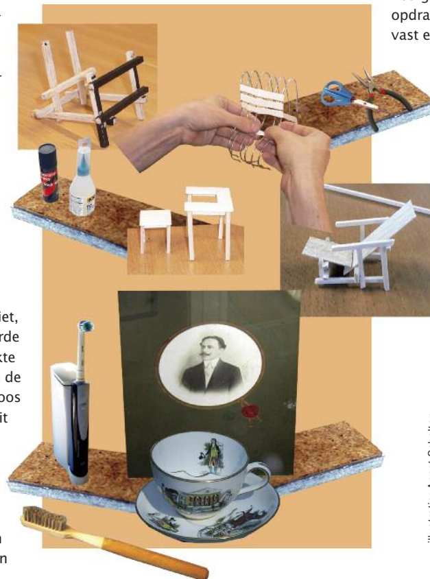
illustratie: Annet Scholten