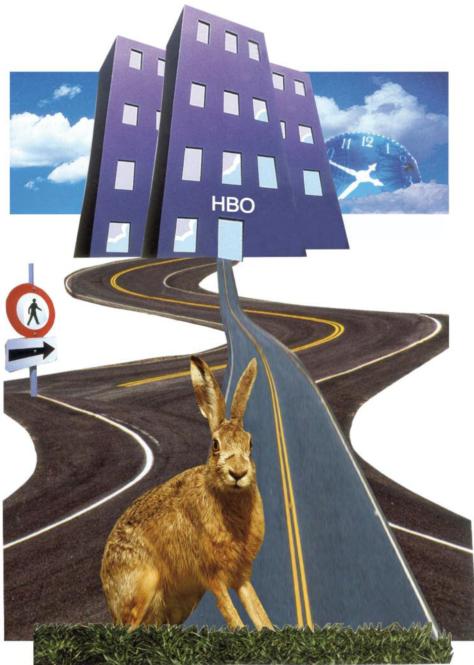
Met een AD kun je in twee jaar een hbo-diploma halen, al heeft dat niet dezelfde status als een bachelordiploma.