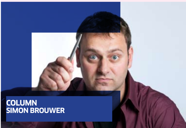
COLUMN SIMON BROUWER