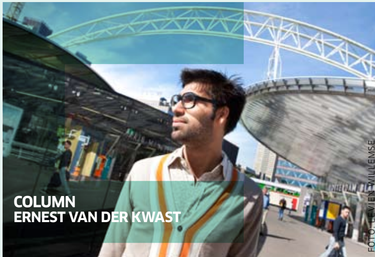
COLUMN ERNEST VAN DER KWAST