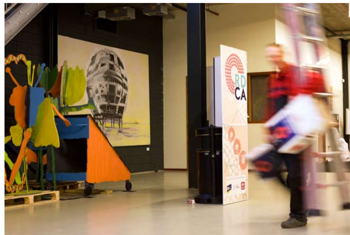
Werk: Yellow Planet, 2006, schilderij Locatie: RDM Campus Kunstenaar: Eveline Visser, afgestudeerd in 1971

Als je de school binnenloopt richting de westvleugel, dan passeer je het werk van 3x6 meter. Henkes (1903-1989) schilderde het tafereel van de scheikunde Nobelprijswinnaar Jacob H. van 't Hoff op de muur van het bedrijfsrestaurant van de voormalige raffinaderij van Texaco Pernis. Toen het gebouw gesloopt zou worden, besloot de eigenaar Nerefco om de muurschildering te schenken aan de HR. Het werk kon alleen bewaard blijven door het met (dragende) muur en al te verwijderen. Met een speciaal transport werd de muur in 2005 verplaatst naar de locatie Kralingse Zoom. Vierdejaars commerciële economie Erik Kleyweg (23) is er talloze malen langs gelopen. Maar dat het een 'echte' Dolf Henkes was, wist hij niet. 'Ik ervaarde het niet als een kunstwerk, meer als decoratie. Je ziet een soort docent en twee leerlingen. De een lijkt het niet te snappen, de ander zit een beetje te spelen. Dat het zich afspeelt in een laboratorium past niet zo bij het economische karakter van deze locatie, maar ik snap dat het een groot werk is dat je niet overal kwijt kunt.' Prima dat de hogeschool werk van oud-studenten aankoopt, vindt Erik. 'De hogeschool straalt daarmee vertrouwen uit in haar afgestudeerden. Maar als voor hetzelfde geld ook honderd computers kunnen worden gekocht, dan liever dat. Eerst moeten het onderwijs en de voorzieningen top zijn.'