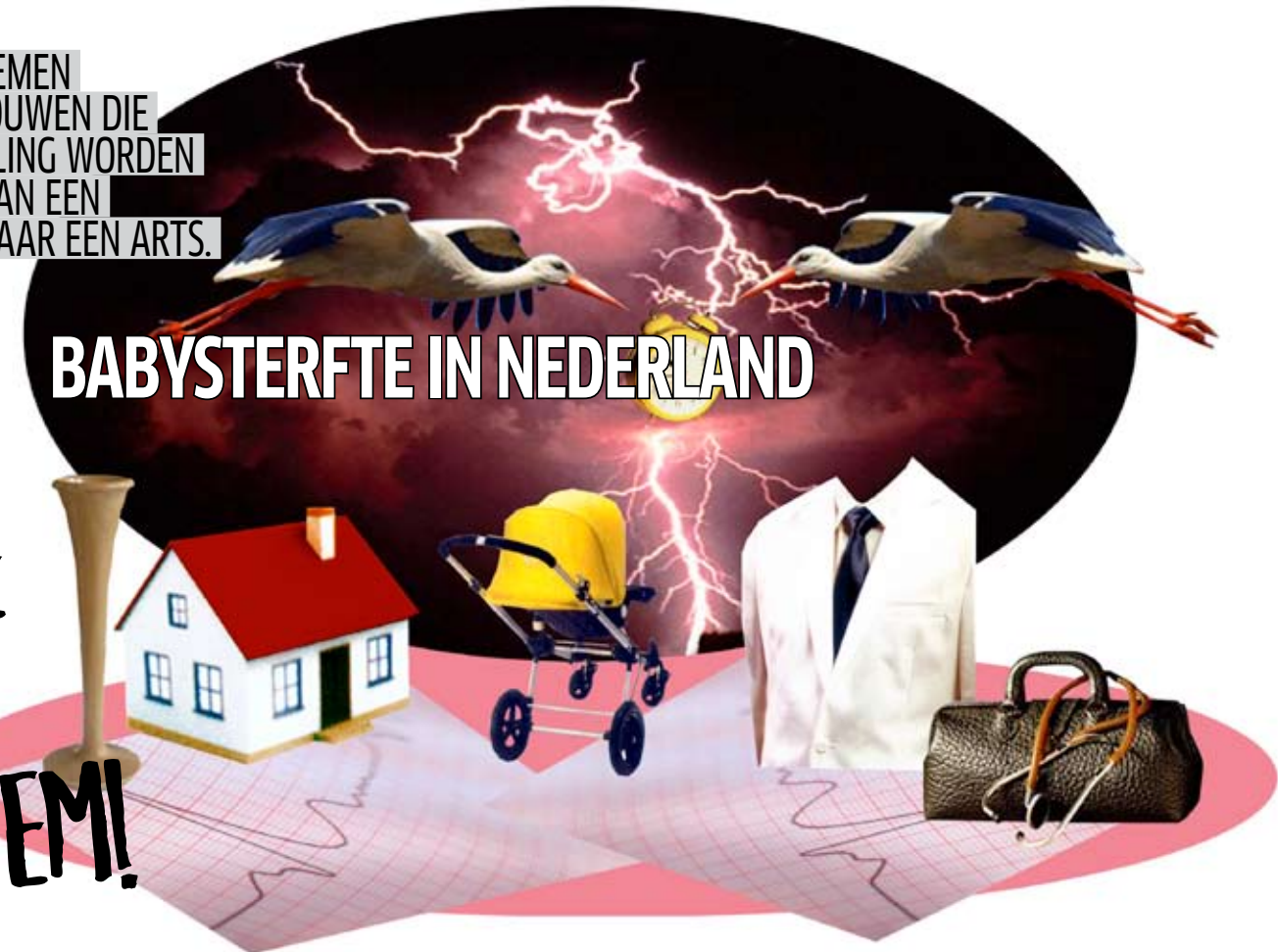
ILLUSTRATIE: ANNET SCHOLTEN

Eind 2010 in de media: 'Bevallen bij een verloskundige leidt tot een verhoogde kans op babysterfte.' Tijdens het jaarlijks terugkerende januari-symposium van de master klinische verloskunde gaan verloskundigen en artsen in discussie. De – zwangere – Profielen-redacteur hoort het in verwarring aan.