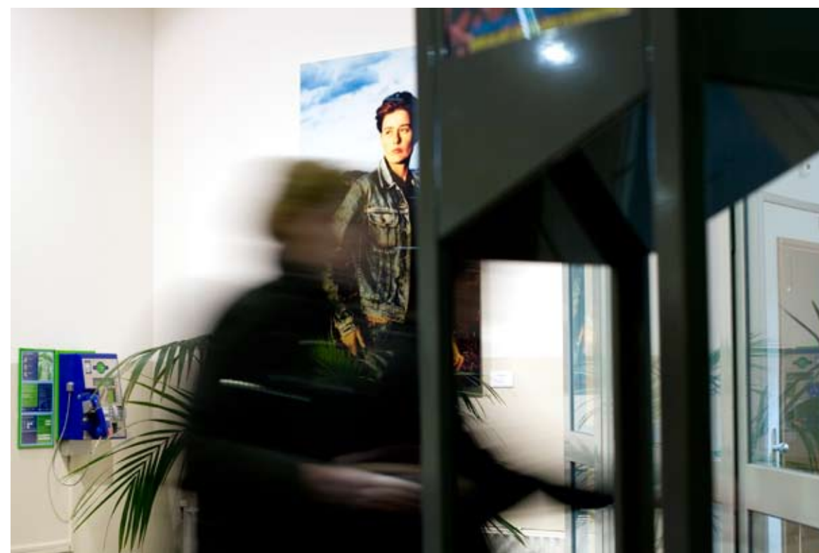
Werk: Giant, 2001, foto Locatie: hal Academieplein Kunstenaar: Risk Hazekamp, afgestudeerd in 1995