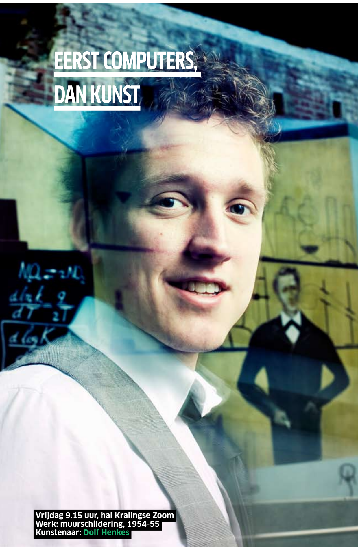
Vrijdag 9.15 uur, hal Kralingse Zoom Werk: muurschildering, 1954-55 Kunstenaar: Dolf Henkes