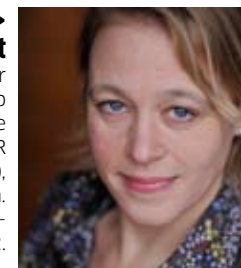
< HANS REITZEMA Fotograaf en HR-medewerker

Ze was 14 jaar politiek verslaggever voor Radio Rijnmond en Het Oog op Morgen. Sinds 2010 is ze freelance journalist (o.a. voor BNR Nieuwsradio, Omroep West), schrijft ze en leidt debatten. Zie haar stuk over cultuurbezuinigingen en de WdKA op p. 12.