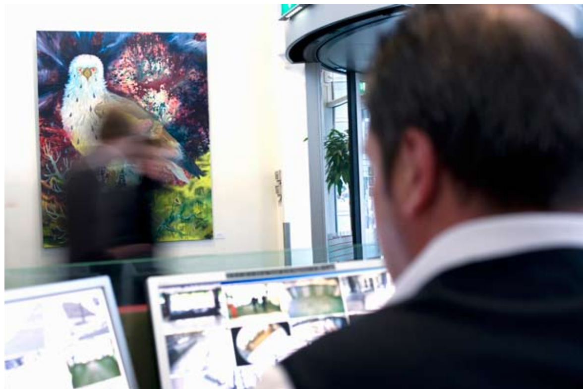
Werk: Regenboogvogel, 2008, schilderij Locatie: hal Museumpark, hoogbouw Kunstenaar: Hidde van Schie, cum laude afgestudeerd in 2001

tekst Esmé van der Molen