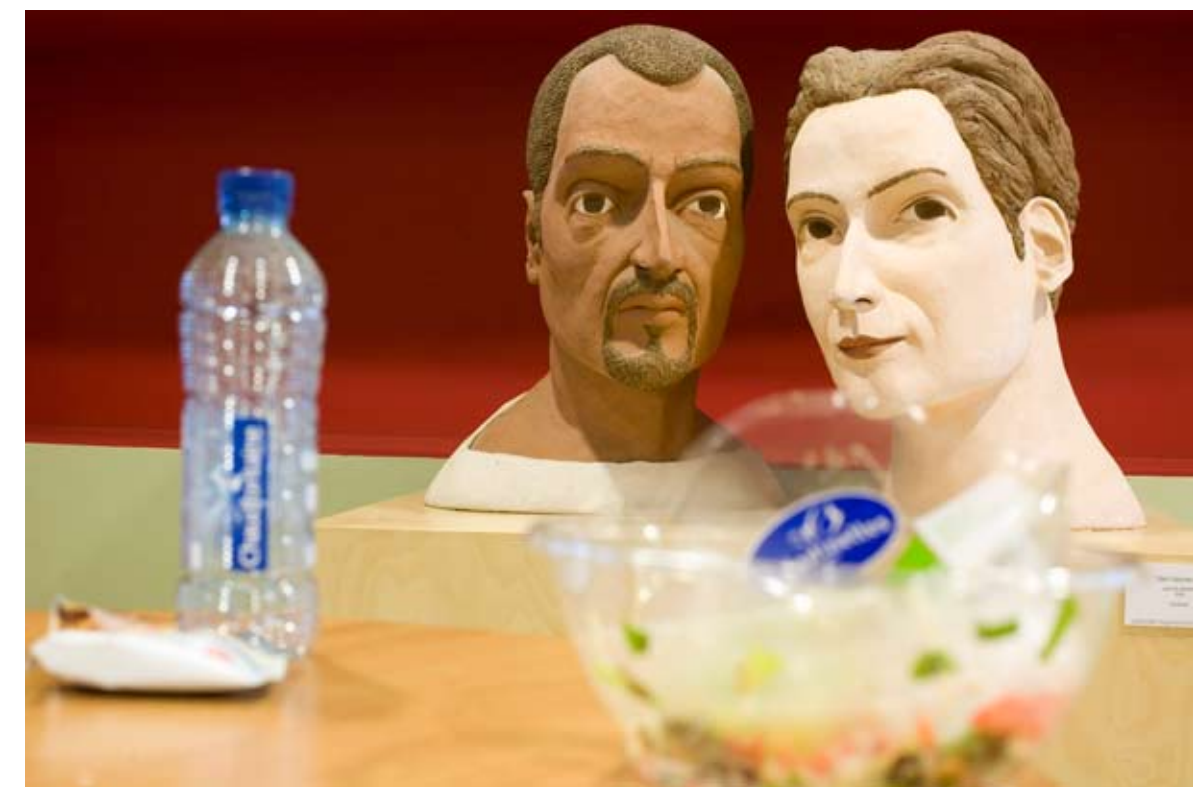
Werk: Cyrus & Elisabeth, 2005, beelden keramiek Locatie: Museumpark, kantine Kunstenaar: Cert Germeraad, afgestudeerd in 1991