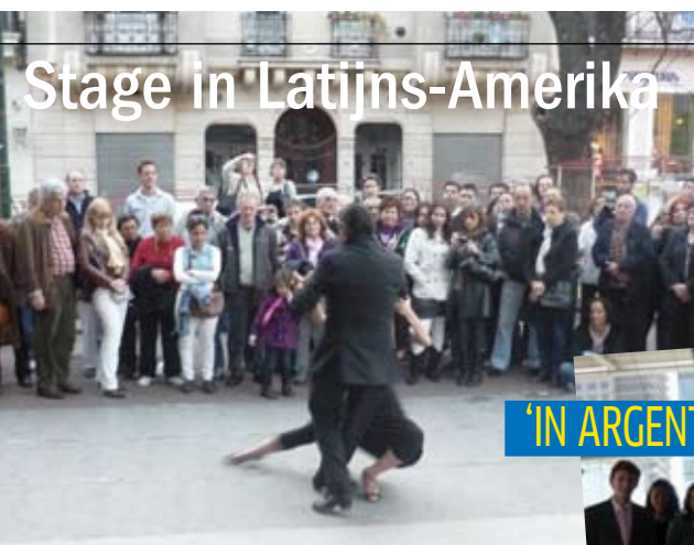
Stage in Latijns-Amerika