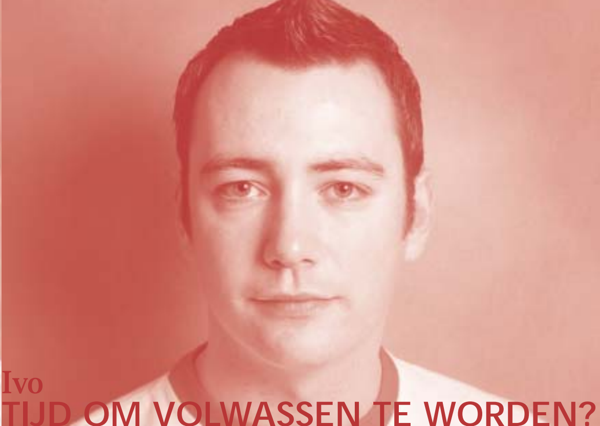
Ivo TIJD OM VOLWASSEN TE WORDEN?