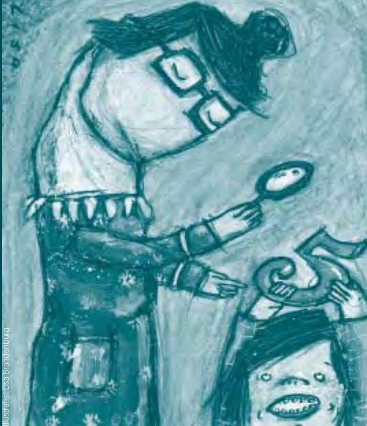
Illustratie: Lisa Brandenburg