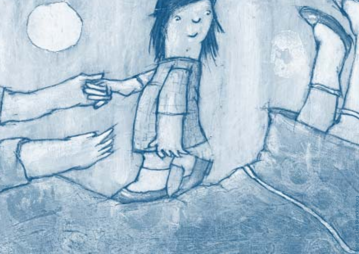
Illustratie: Lisa Brandenburg