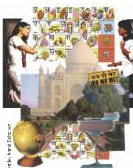
Illustratie: Annel Scholten